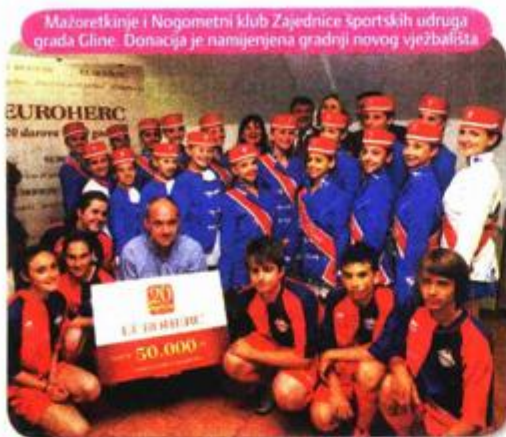
Mažoretkinje i Nogometni klub Zajednice sportskih udruga grada Gline. Donacija je namjerjena gradnji novog vježbališta

- Akcija je započela na Međunarodni dan obitelji 15. svibnja, a završit će u listopadu kada će sve donacije biti realizirane i kada i svečano obilježavamo