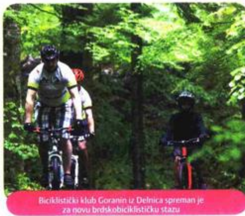
Biciklistički klub Goranin iz Delnica spreman je za novu brdskobiciklističku stazu